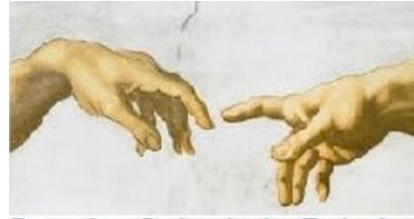
Prendre Soins de la Relation